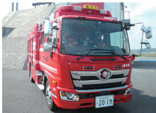
更新した「水槽付消防ポンプ自動車」と「高規格救急自動車」