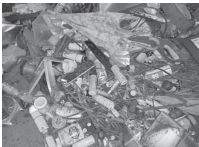
その他の燃えないごみ