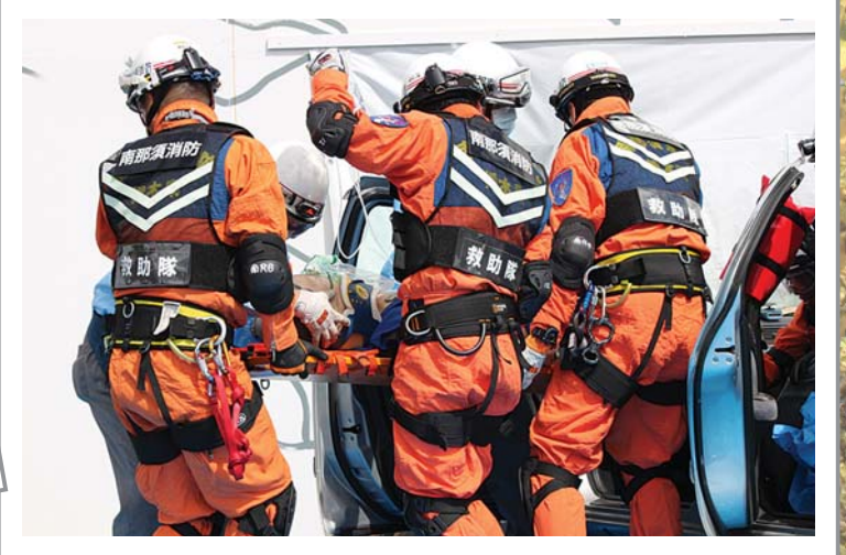
栃木県・那須烏山市総合防災訓練（平成24年9月2日）